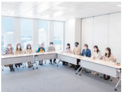
※①～⑥の写真はイメージ