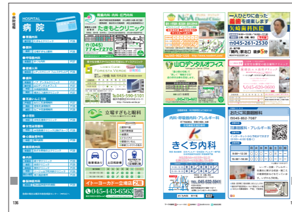
◀病院・医療情報 ※「病院、医療」の例

地元の医療機関情報！ 「年間保存メディア」だからこそ、マッチするコンテンツです。