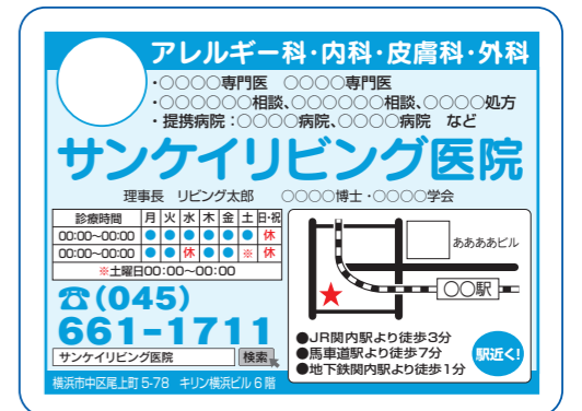
▲ディスプレイ広告 1/8 ページ (イメージ) ※「病院、医療」の例