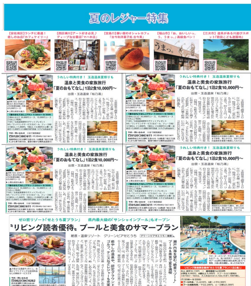
レギュラータイアップ 構成イメージ