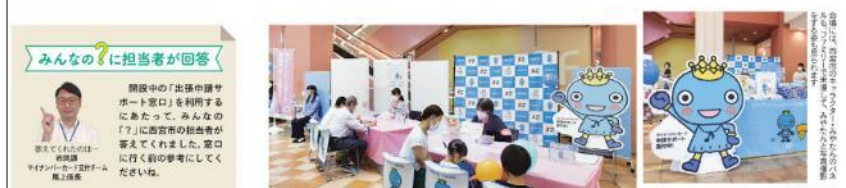
みんなの？に担当者が回答 副課長の「出張申請サポート窓口」を利用するにあたって、みんなの「？」に西宮市の担当者が答えてくれました。窓口に行く前の参考にしてください。

マイナンバーカード交付申請をしやすくするために、西宮市では、マイナンバーカード出張申請サポート窓口を開設中です。会場は、いずれも身近なショッピングセンターなので、買い物のついでなどに気軽に立ち寄れます。