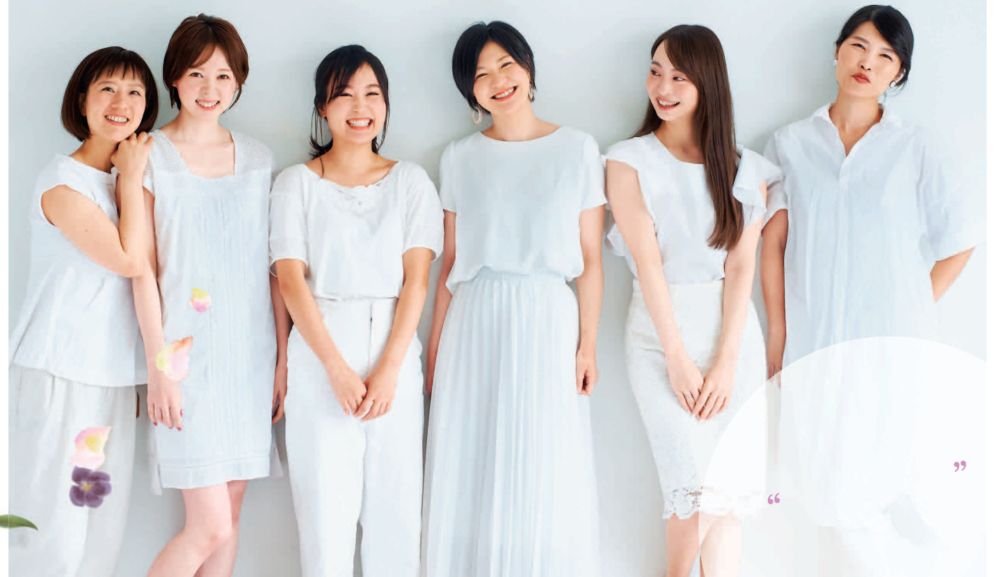
シティリビング公式読者モデルのみなさん データは2019年シティリビングネットワーク読者調査より